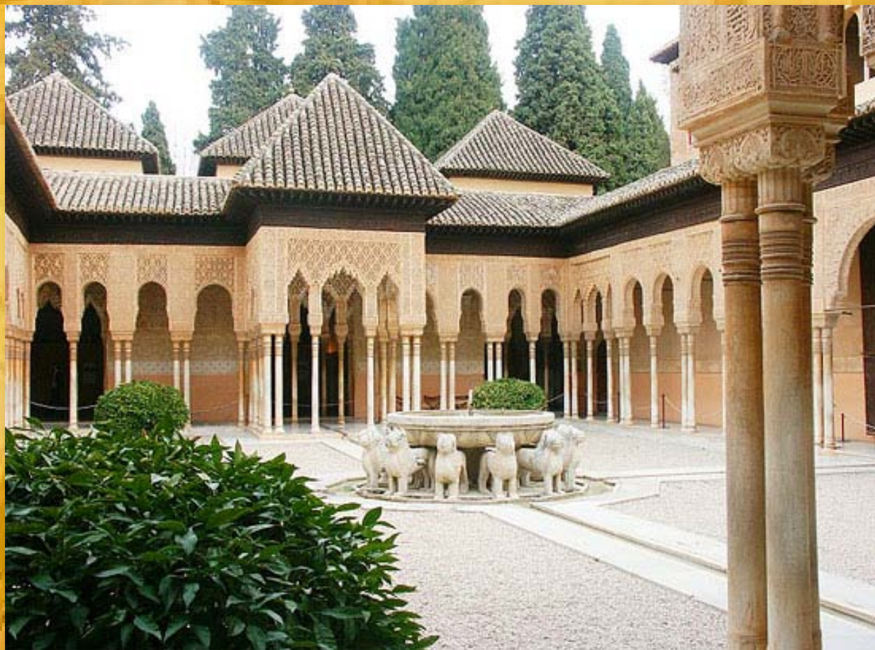
LA ALHAMBRA (construida en el siglo XV), Granada, Andalucía